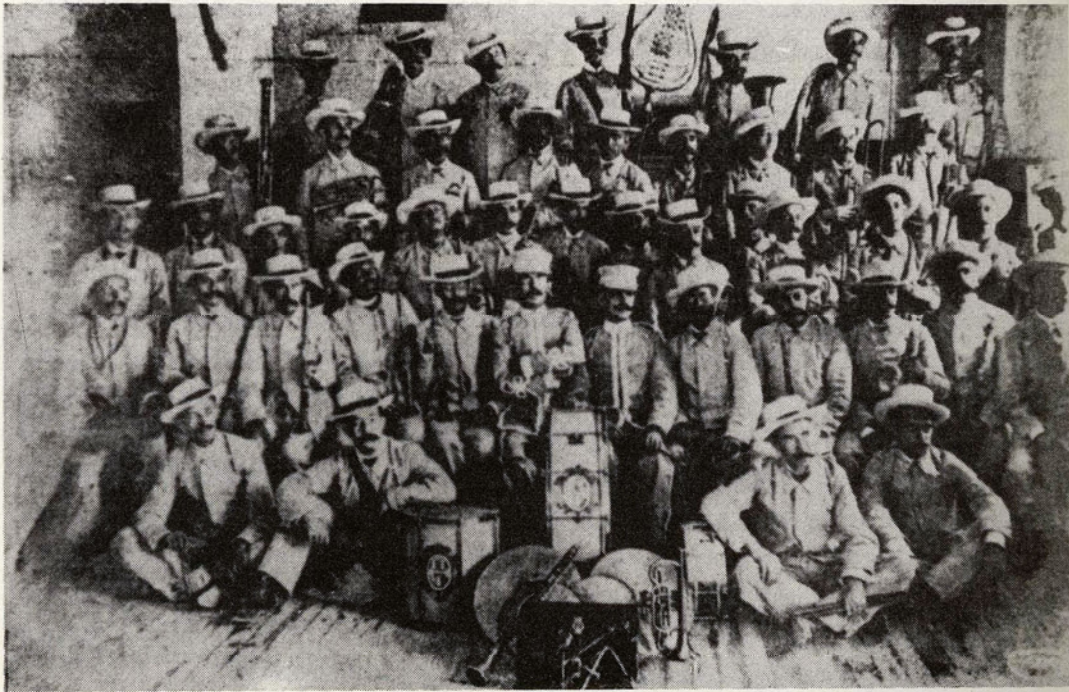
Banda del Regimiento de Infantería